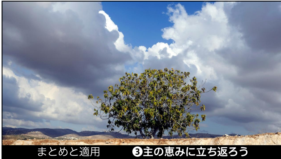
まとめと適用 ③主の恵みに立ち返ろう