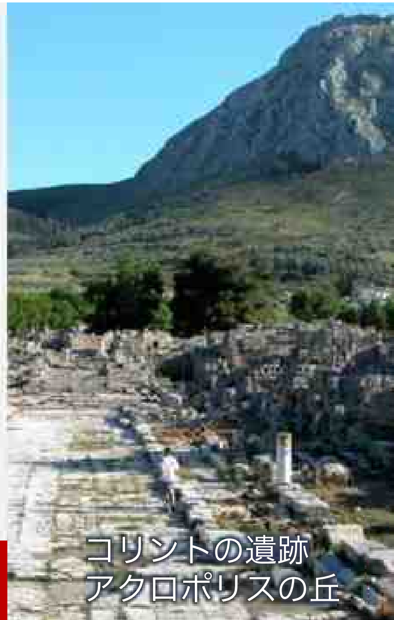
コリントの遺跡 アクロポリスの丘