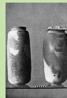
死海写本が収められていた壺