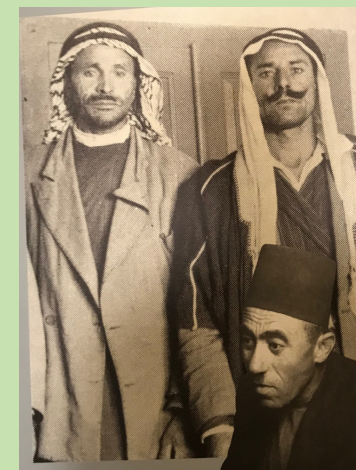
死海写本発見の羊飼いの写真 左上16歳、右上その従兄弟 右下古物商カンドー氏